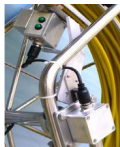
odomètre incréméntation écran