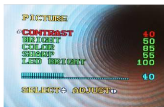
écran TFT couleur